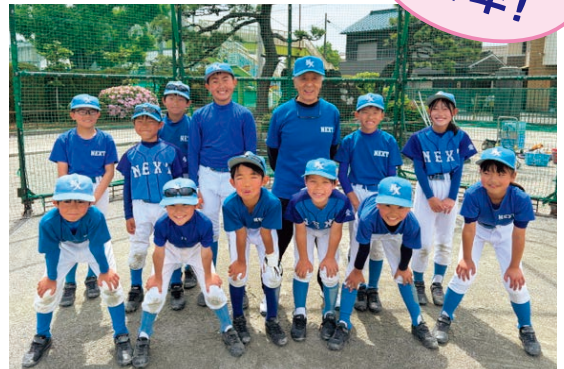
NEXT西春スポーツ少年団

息子と一緒に平成8年9月、NEXT西春スポーツ少年団に入団しました。監督からはコーチがいないので即コーチをやってほしいと言われ、野球経験者でもあり、自分も体を持て余していたので、二つ返事で受けました。それがちょうど30年前、あれから30年です。そして、しばらくすると監督をやってくれないかと言われ、20年監督・コーチをやり10年前から代表をやっております。