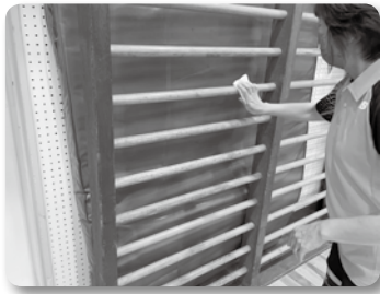
ソフトバレーボールクラブ (鴨田小学校体育館清掃)

日頃利用していますスポーツ施設の美化強化月間を設け、清潔で美しいまちづくりを推進します。