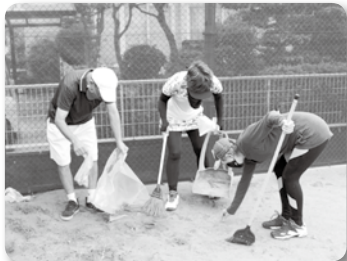
テニス協会 (芸大テニスコート清掃)