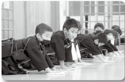
師勝武道館 (総合体育館剣道場清掃)