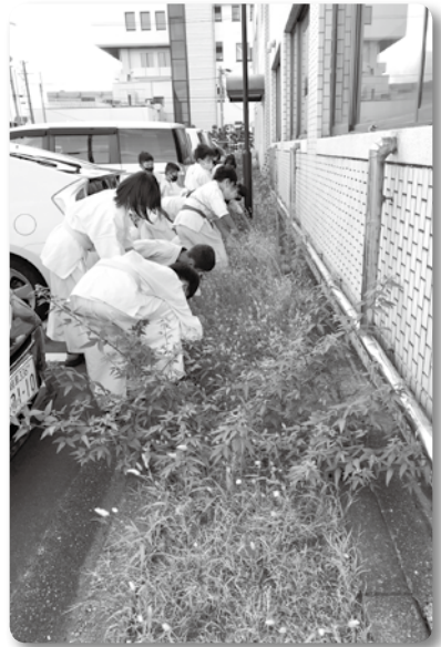
フルコンタクト空手道連盟 (総合体育館駐車場清掃)