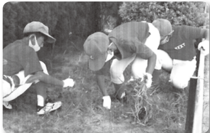
スポーツ少年団 NEXT 西春 (西春小学校清掃)