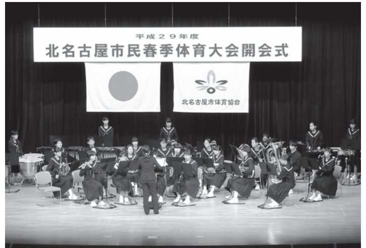
訓原中学校ブラスバンド部の皆さん