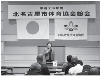
平成29年度総会の様子