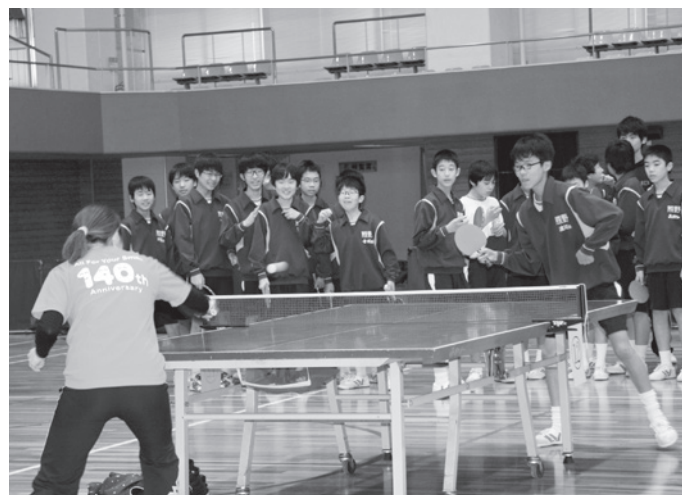
指導者：(株)十六銀行 女子卓球部員の皆さん